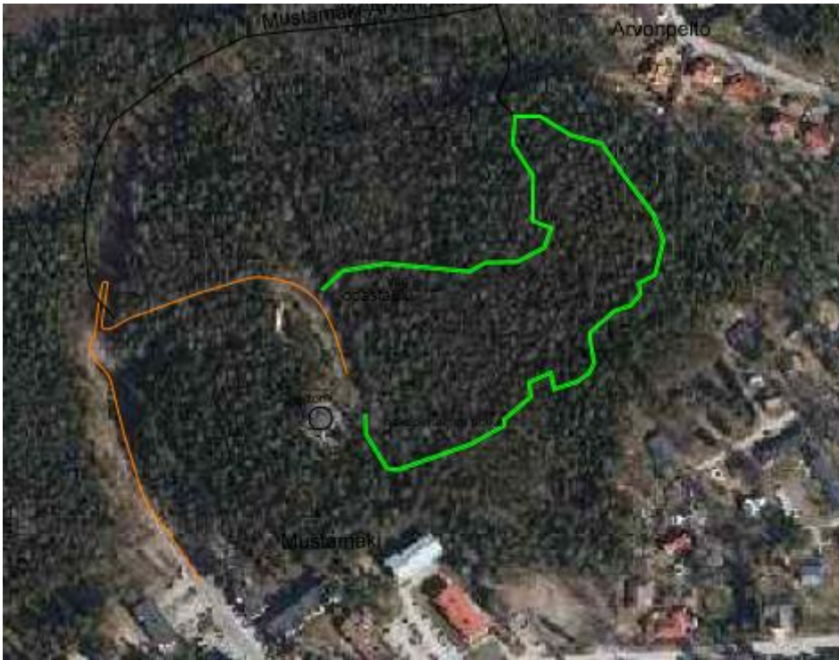
Alustava Terveysmetsä-hankkeen reittilinjaus suunnittelualueella.