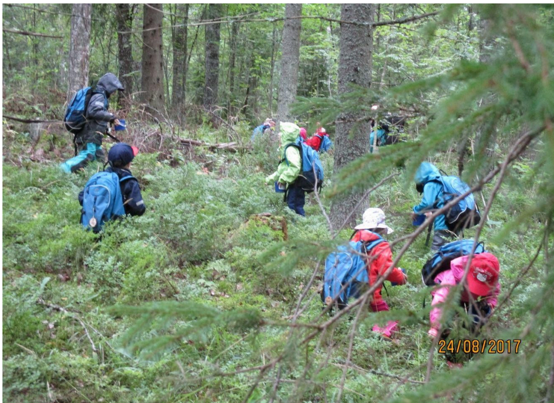
Kuva 2. Metsäretkellä

Esiopetuksen lähtökohtana on Esiopetuksen opetussuunnitelman perusteiden 2014 tavoitteet sekä lapsen yksilölliset kasvu-, kehitys- ja oppimisedellytykset. Esiopetuksen aikana tuetaan lapsen kokonaisvaltaista hyvinvointia yhteistyössä huoltajien kanssa. Esiopetuksessa arvostetaan ja kuunnellaan lapsen käsityksiä, tunteita ja mielipiteitä. Lapsi harjoittelee yhteistyö- ja sosiaalisia taitoja vuorovaikutuksessa ympäristönsä kanssa mm. leikissä. Kaikessa toiminnassa huomioidaan kasvu- ja oppimisympäristö kestävä kehityksen ja lapsen osallisuuden periaattein.