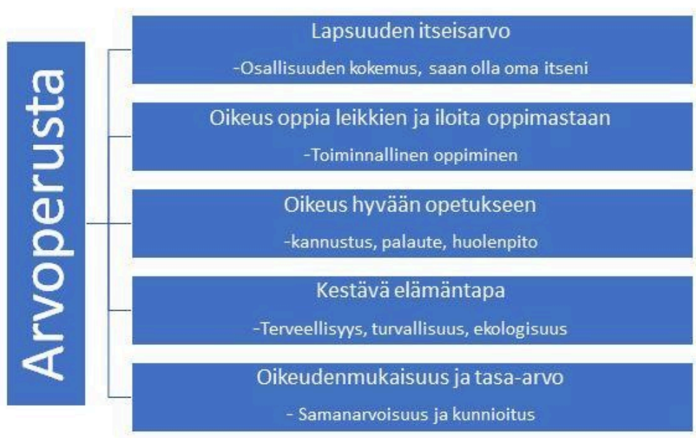
Kaavio 2. Arvoperusta

Esiopetuksen henkilöstö huomioi valtakunnalliset ravitsemus- ja liikuntasuositukset esiopetuksen arjessa. Lapsia ohjataan terveellisiin elämäntapoihin liittyvissä asioissa. Ekologinen elämäntapa näkyy arjessa esimerkiksi kierrättämisen opettamisen kautta. Mäntsälän esiopetuksessa tuetaan lapsen luontosuhdetta.