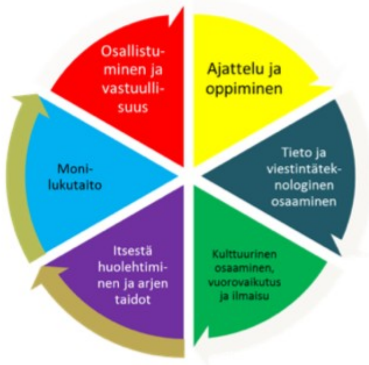
Kaavio 3. Laaja-alainen osaaminen esiopetuksessa

osaamisen osa-alueiden toteutumista jatkuvasti sekä toimintavuoden lopuksi yksikkökohtaisessa lukuvuosisuunnitelmassa.