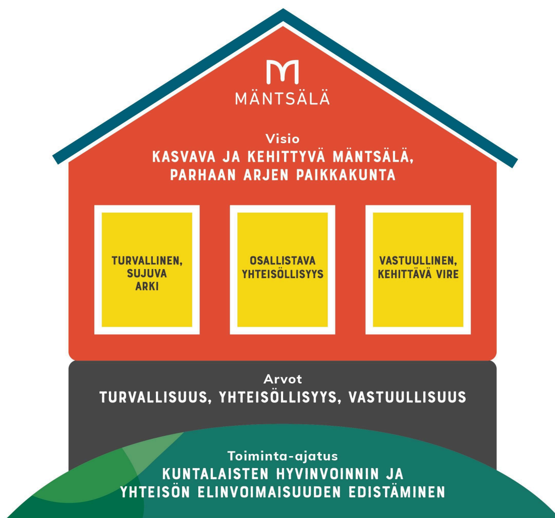
Kaavio 1. Mäntsälän kunnan kuntastrategia ja kärkitavoitteet 2022-2025

Esiopetuksessa noudatetaan kestävästä elämäntavasta periaatteita ja otetaan huomioon sen eri ulottuvuudet: sosiaalinen, kulttuurinen, taloudellinen ja ekologinen. Esiopetus toimintaympäristönä tukee lasten tasa-arvoisuutta. Siihen sisältyvät muun muassa mielipiteiden ja sukupuolten tasa-arvo. Esiopetus edistää lasten mahdollisuuksia kehittää kykyjään ja tehdä valintoja ilman sukupuolesta johtuvia ennako-odotuksia ja rajoituksia. Tasa-arvopyrkimyksiä täydentää laaja-alainen yhdenvertaisuuden 37 periaate. Opetus on lapsia puoluepoliittisesti, uskonnollisesti ja katsomuksellisesti sitouttamaton. Esiopetusta ei saa käyttää kaupallisen vaikuttamisen kanavana.