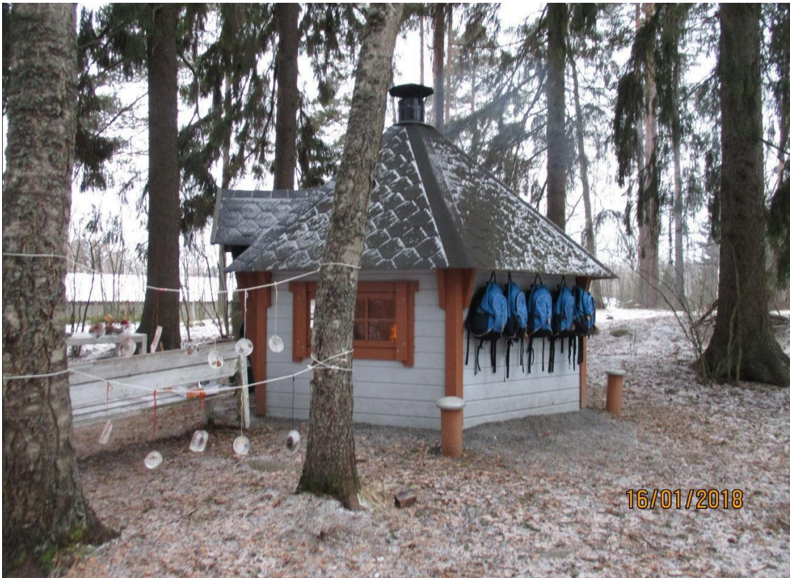
Kuva 1. Luontoesiopetus

Mäntsälän kunnan esiopetuksen opetussuunnitelma 2023 on luettavissa Mäntsälän kunnan internet sivuilla ja jokaisessa esiopetusyksikössä. Mäntsälän esiopetuksen opetussuunnitelmaa tarkentavasta vuosittaisesta suunnitelmasta käytetään nimitystä yksikkökohtainen lukuvuosisuunnitelma. Vuosittaisesta lukuvuosisuunnitelmasta tiedotetaan vanhempainilloissa.